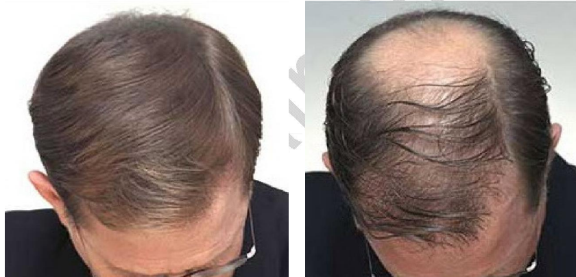
پس از استعمال

عوامل پرپشت کننده مو یکسری مواد به صورت های گوناگون هستند که تهیه آنها نیازی به نسخه پزشک نداشته و می توانند در عرض چند دقیقه به صورت ظاهری و موقتی موجب ایجاد حس پرپشتی و تراکم در موهای کم پشت شده و بدین ترتیب حس اعتماد به نفس فرد را با اثر روانی مثبت بر او تقویت نمایند. این مواد را می توان در کنار درمان های دارویی، جراحی و کاشت مو استفاده نمود و حتی گاهی به جای یک درمان پرهزینه و ناموفق می توان از این مواد به عنوان جایگزین درمان های فوق بهره جست. بسیاری از مبتلایان به طاسی از اثرات مفید این مواد بی اطلاع هستند و حس بدی که در جوامع سنتی نسبت به استعمال این عوامل وجود دارد بر این مسئله دامن می زند درحالی که استفاده درست و منطقی از آنها در تقویت روحیه فرد بسیار مؤثر می باشد.