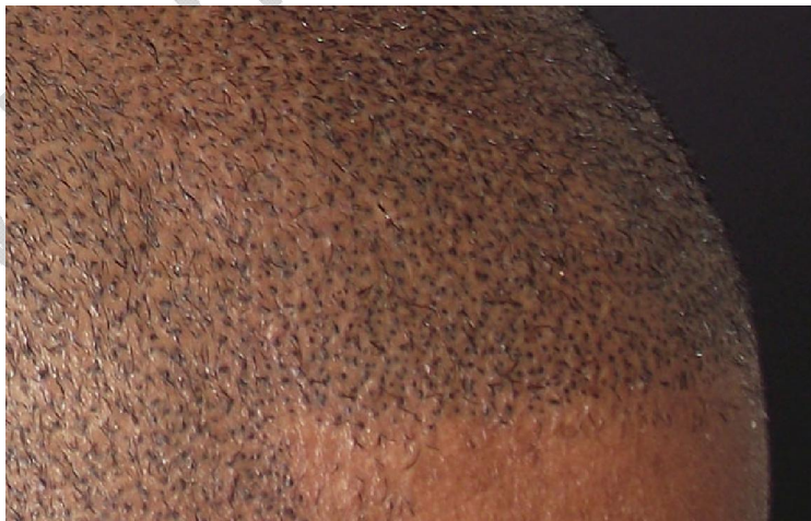
نقطه های رنگی کنار هم در SMP

برای فهم دقیق SMP لازم است که 2 مطلب مورد بررسی قرار گیرد: خطای دید و پیکسل (نقاط رنگی). مطمئناً شما نقاشی های خیابانی سه بعدی را دیده اید. در این حالت نقاش با استفاده از ترکیب استادانه سایه ها و زوایا و چیدمان هنرمندانه آنها در یک سطح دو بعدی حالتی را بوجود می آورد که مگر بیننده تصور سه بعدی احساس می کند و این خطای دید می باشد. پیکسل ها نقاط نورانی هستند که از ترکیب و قرار گرفتن آنها در کنار هم تصویر بوجود آمده و واضح است که هر چقدر تعداد پیکسل ها در سانتیمتر مربع بیشتر باشد به همان اندازه وضوح تصویر نیز بالاتر خواهد رفت.