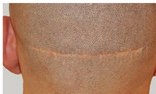
اسکار FUT قبل از انجام SMP

2) امکان برداشت نوار پهن تر در FUT: اگر قبل از انجام FUT در مورد SMP با فرد توافق شده باشد با استفاده از آن می توان در FUT اول از پشت سر نوار پهن تری برداشت نمود و لذا تعداد موی بیشتری در دسترس خواهد بود که بالطبع تراکم بالاتری ایجاد می کند و این یکی از مزایای بزرگ SMP است. اسکار حاصله از برداشت نوار پهن تر را می توان به سادگی با SMP مخفی نمود.